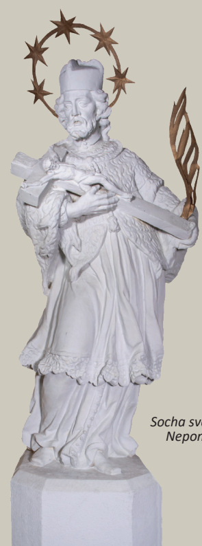
Socha svatého Jana Nepomuckého

Zámecká věž je ze strany nádvoří vysoká 52 metrů a ze strany zámecké zahrady pak 58 metrů. Na vrchol vede 245 kamenných a dřevěných schodů.