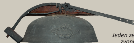
Jeden ze dvou barokních zvonů typu cimbál