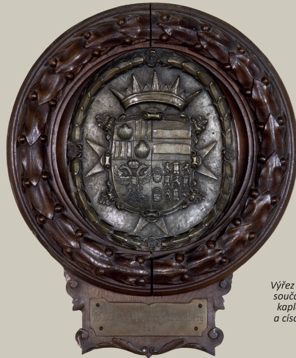
Výřez části zvonu s marradasovským erbem je současně umístěn před vstupem do zámecké kaple. Baltasar Marradas byl šlechtic, rytíř a císařský polní maršál španělského původu. Hlubocké panství získal roku 1622.

Urbář z roku 1677 zmiňuje i přítomnost zvonů na zámecké věži. Před barokní přestavbou byly na věži „prastaré zvony, které nechal dělat ještě Marradas za tehdejších husitských a kalvínských časů.“ (Výřez části zvonu s marradasovským erbem datovaného k roku 1629 je dodnes vystaven před vstupem do zámecké kaple.) Staré zvony byly ve 20. letech 18. století sejmuty a nahrazeny třemi novými barokními, zdobenými schwarzenberským znakem a obrázky svatých. Vysvěceny byly k počtě svatého Josefa, Donáta a Jana Nepomuckého v roce 1729. Na svých místech vydržely až do 2. září 1846, kdy byly sundány v rámci poslední přestavby zámku. Barokní zvony z hlubockého zámku byly pak druhotně zavěšeny do věže nově postaveného hlubockého farního kostela. Do poslední přestavby zámku v 19. století totiž na Hluboké nebyl kostel a zdejší farníci každou neděli chodili na mše do zámecké kaple.